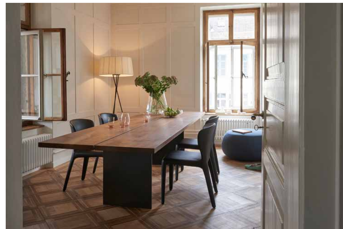
TIX - Das Original von Zoom by Mobimex

TIX verbindet funktionelle und ästhetische Aspekte auf höchstem Niveau. Die vertikale Tragstruktur in Aluminium oder Stahl - technisch und präzise und die horizontale Tischplatte in massivem Holz, sorgfältig ausgesucht und verarbeitet- ursprünglich, warm und natürlich. Zwei Materialien, die kaum unterschiedlicher und spannender sein könnten, bilden eine perfekte Funktionseinheit.