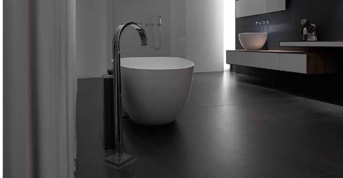
Das gestalterische Prinzip großer zusammenhängender Flächen setzt sich im Badezimmer fort, dessen Einrichtung der Bauherr selbst entwarf. Die ausführende Schreinerei regte die Verwendung originaler Eichenbalken aus einem Fachwerkhaus für die Badmöbel an.